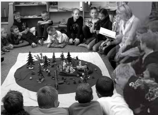
► Viele BesucherInnen beim Lesevormittag in der Bücherei Virgen