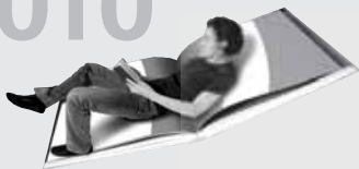
► Lesung mit Paulus Hochgatterer in der Stadtbibliothek Mistelbach