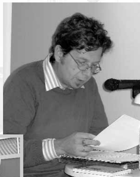
▶ Franzobel bei einer Lesung im Rahmen der Kinder- und Jugendliteraturtage der Stadtbibliothek St. Veit