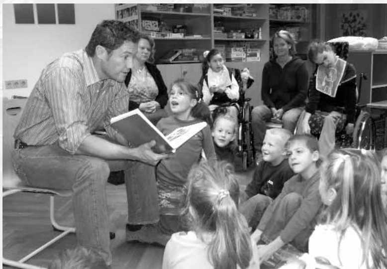
▶ Stadtbibliothek Hermagor: Armin Assinger, Moderator der Millionenshow, weiß auch die Kleinsten zu begeistern