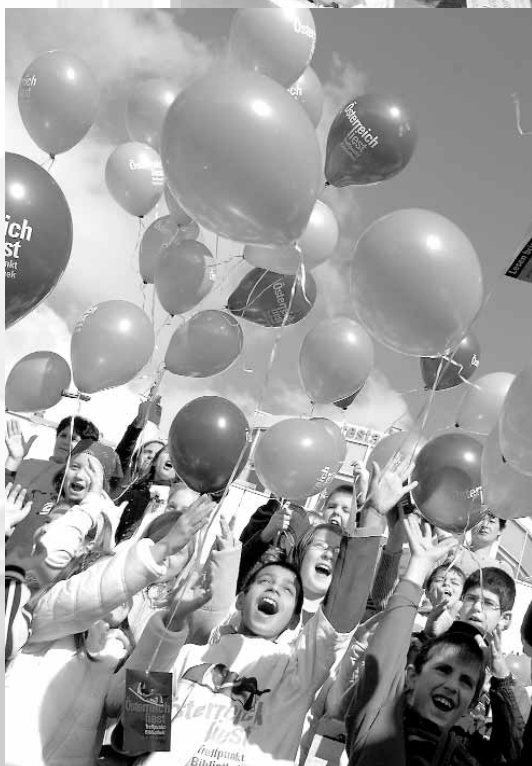
► 80 000 Luftballons als weithin sichtbares Zeichen fürs Lesen in ganz Österreich