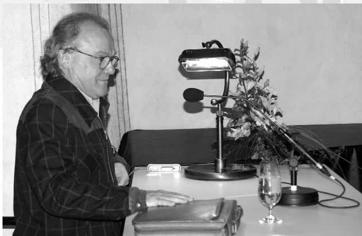
► Die Öffentliche Bücherei Sulz-Röthis veranstaltet gemeinsam mit der „Kultur-Röthis“ eine Lesung mit Michael Köhlmeier