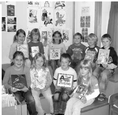
▶ Die Kinder der Öffentlichen Bibliothek der Pfarre, Gemeinde und Schule St. Johann-Köppling freuen sich über die gewonnenen Bücher.

Ö sterreichs Bibliotheken begeisterten vom 16.–22. Oktober 2006 mit tausenden Veranstaltungen ihr Publikum. Von Lesungen über Bilderbuchkinos, Vorlesestunden, Ausstellungen bis hin zur Präsentation der Lieblingsbücher prominenter Persönlichkeiten reichte das Spektrum. Viele dieser Bibliotheken nahmen auch am Gewinnspiel teil und nutzten die Chance, eines von 20 Buchpaketen zu gewinnen. Wir möchten an dieser Stelle den Gewinnern herzlich gratulieren: