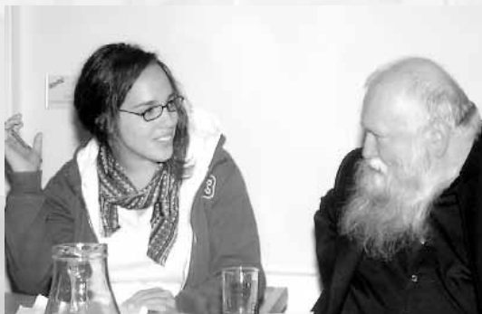
▶ Nach seiner Lesung diskutiert Prof. Hermann Nitsch im BORG Mistelbach mit den SchülerInnen