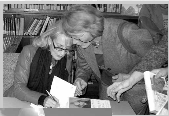
► Bibliothek Königstetten: Gelungener Bücherabend mit Dagmar Koller