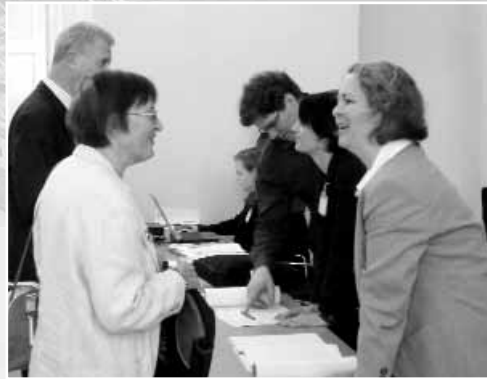
▶ Die MitarbeiterInnen des BVÖ kümmern sich um die Anliegen der KongressbesucherInnen