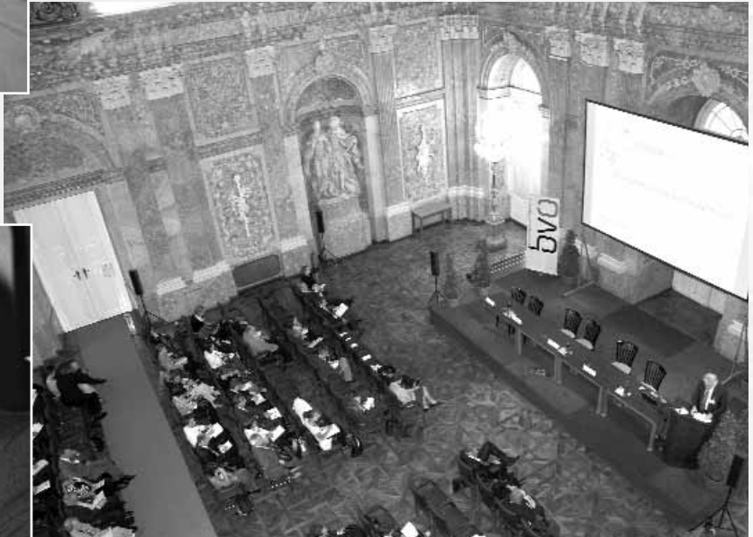
▶ Vortragsort ist der Festsaal der Österreichischen Akademie der Wissenschaften