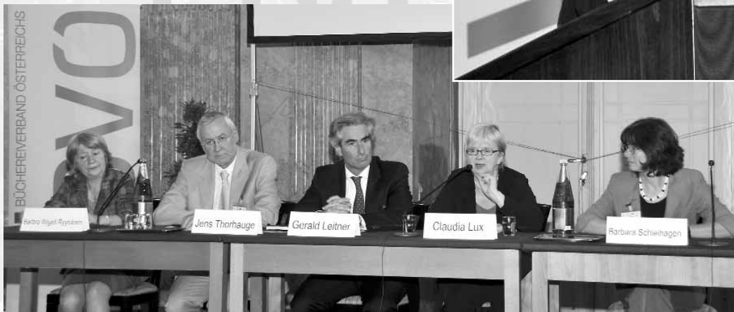
▶ In den Podiumsdiskussionen stellen sich die Vortragenden den Fragen der TeilnehmerInnen